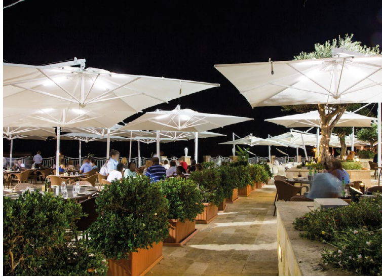
RADISSON HOTEL MALTA